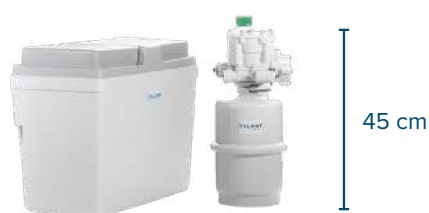
TALENT 100B KAPACITET SALTOKAR: 30 KG

RESIN VOLUME: 3 LITER - FLOW RATE: 1.500 LITER/TIME