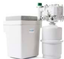
TALENT 100BS KAPACITET SALTOKAR: 10 KG