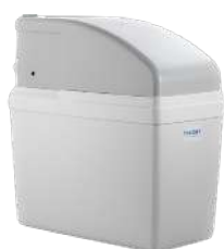
TALENT 100M KAPACITET SALTOKAR: 15 KG

Kompakt simplex alt-i-et blødgøringsanlæg Kan tilsluttes bagpå eller på begge sider.